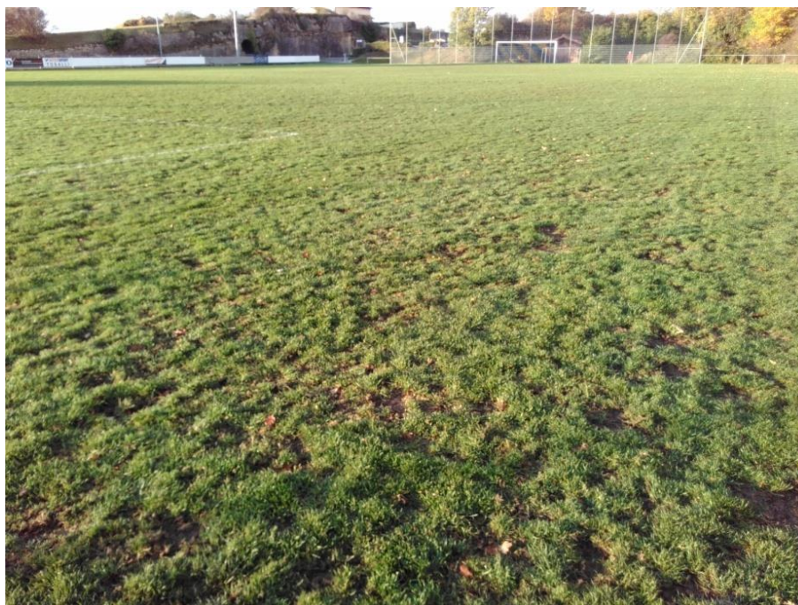
Etat de la pelouse en octobre 2017