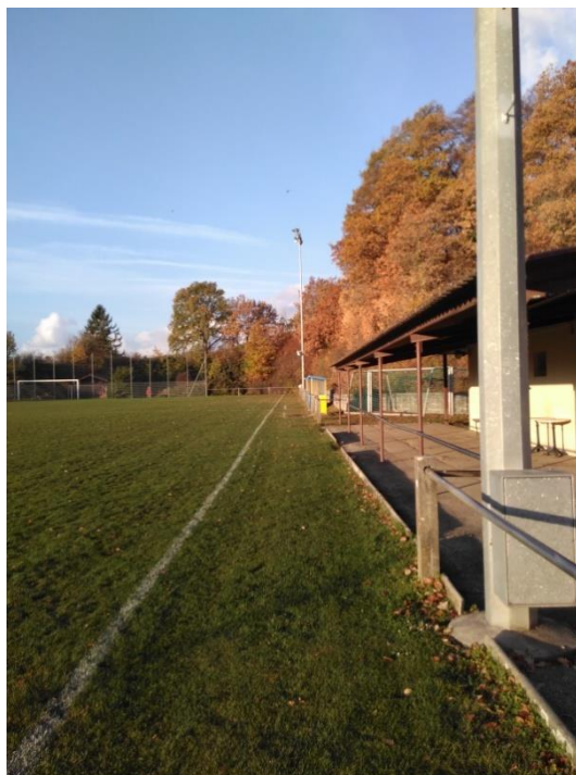
La distance actuelle entre la ligne de jeu et les bordures (<2m) ne répond pas aux normes de sécurité

L'éclairage du terrain pour des matchs officiels en nocturne ne répond pas non plus aux normes de l'ASF relatives à l'intensité et l'uniformité lumineuses (contrôle de 2016). Le club a obtenu une dérogation jusqu'en 2018 uniquement. Le changement d'éclairage (et donc le périmètre de sécurité) devront donc se faire cette année encore, quelle que soit la décision prise concernant le terrain lui-même.